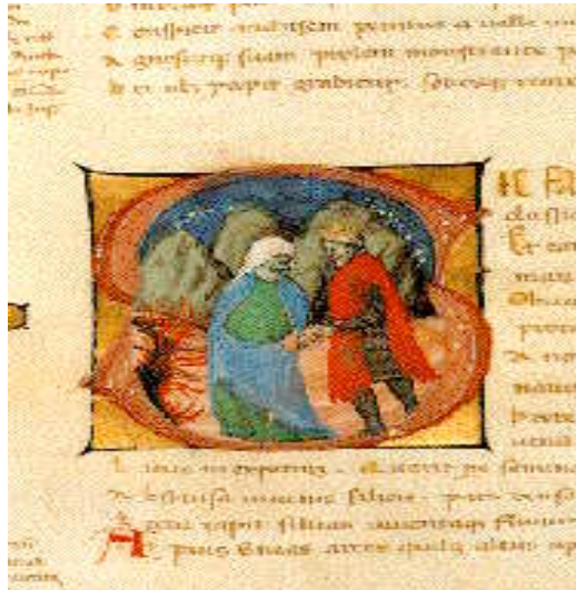
La Sibilla Cumana conduce Enea alle porte dell' Ade. Miniatura di scuola meridionale per il VI libro dell'Eneide. Ms. Membr. IV E 6 (XV sec.). Napoli Biblioteca Nazionale Vittorio Emanuele III

La leggenda che indica la Sibilla Cumana come autrice dei Libri Sibillini trova riscontro nel fatto che l'area cumana fosse sede di oracoli sin da età remota. E' forse più sulla scorta di questa tradizione locale che sulla presunta origine cumana dei Libri che Virgilio nel libro VI dell'Eneide, descrisse la figura tremenda della Sibilla, maestosa sacerdotessa di Apollo e di Ecate Trivia, custode degli oracoli divini e delle porte dell'Ade che mostra il futuro e gli abissi del Tartaro a Enea quando sbarcò presso le sponde cumane. Nei poeti posteriori a Virgilio la solitaria, antica grandezza della Sibilla cede il posto a elementi superstiziosi e, talvolta, popolari. Properzio, Ovidio e Lucano tracciano la figura della Sibilla come quella di una vecchia con mille anni di vita, mentre Petronio nel Satyricon descriverà una Sibilla decrepita che, concorde con la testimonianza di Servio, Apollo ha reso immortale ma non eternamente giovane: ella, ridotta a minuscolo essere chiuso in una bottiglia, invoca in greco la morte. Al tempo di Stazio la consultazione dell'oracolo cumano risulta del tutto abbandonata e della sua immagine altro non resta che un simbolo astratto di Cuma.