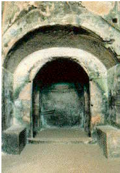
Cuma, Parco Archeologico. "Antro della Sibilla": la sala interna.