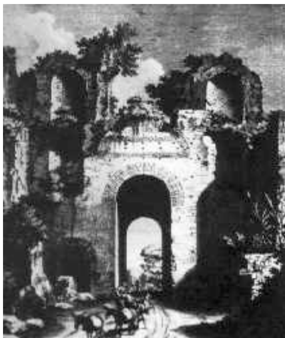
"Veduta di una gran fabbrica nella via di Cuma, i Paesani la chiamano Arco Felice"

Acquaforte di G. B. Natali-G Volpato, in P. A. Paoli (1768), tav. 45 Napoli Biblioteca Nazionale V. Emanuele III