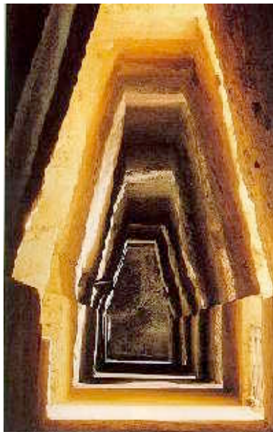
L'antro della Sibilla

Benchè rimaneggiato in epoca ellenistica e romana è certamente collegato al culto oracolare originario di Apollo. Si accede ad esso attraverso un lungo corridoio ( dromos ) di oltre 130 metri. Il dromos è scavato interamente nella roccia tufacea, a partire dall'esterno dell'acropoli lungo il ciglione occidentale della collina, e si inabissa fino a giungere in un vasto ambiente rettangolare con una copertura a falsa volta: l' Antro vero e proprio dove la Sibilla dava i suoi ambigui responsi. Il corridoio è illuminato da sei grandi fenditure aperte in gallerie laterali verso il mare e presenta nella parte superiore una caratteristica sezione trapezoidale che aumenta l'impressione di altezza, già notevole (5 metri circa).